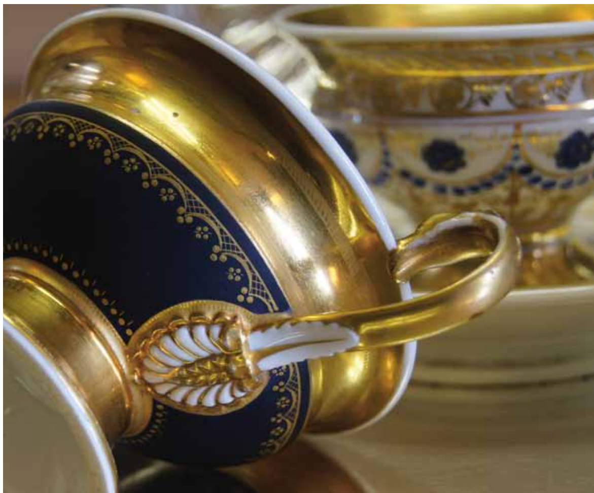
PORCELAINES DE LIMOGES. TRÉSORS DES COLLECTIONS PRIVÉES