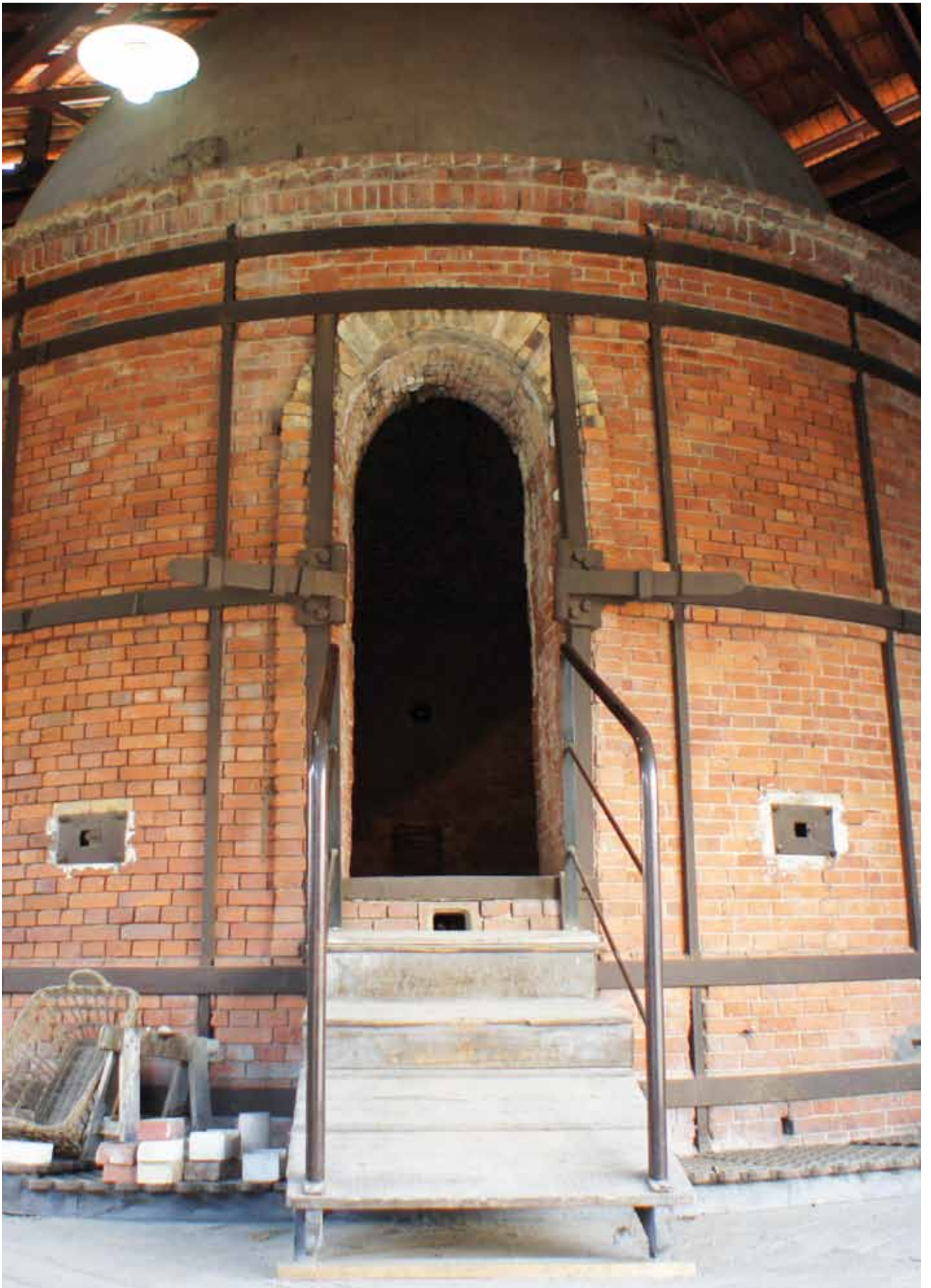
PHOTOGRAPHIE ET PORCELAINES : REFLETS DES BORDS DE VIENNE À LIMOGES AU XIX e SIÈCLE