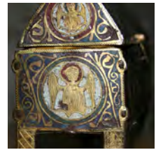
Châsse reliquaire dite de Sainte Germaine Emaux limousins - 13 e siècle