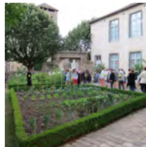
Circuit des expositions 2015