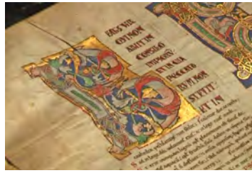
La bible géant romane de Saint-Yrieix visible à la médiathèque a été entièrement numérisée en 2015.