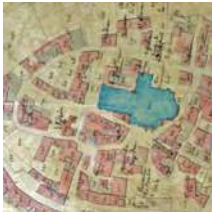
La Ville médiévale Extrait cadastre 1826