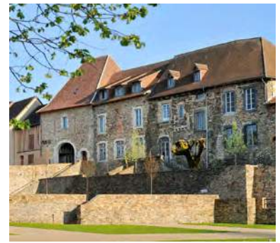
Maison du Patrimoine et place des Hors