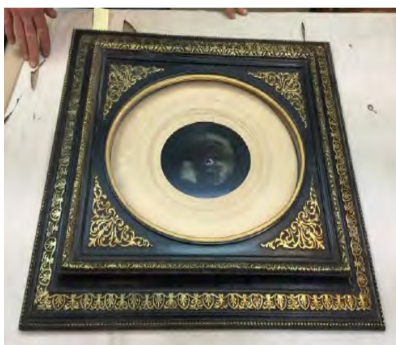
Sophie Zenon & Laetitia Bonneau L'Œil d'Yrieix - 2016

En retour du retable, une seule pièce, sobre et hypnotique. Il s'agit d'une photographie tirée en argentique sur cuivre, émulsionnée à l'ancienne puis projetée sur la plaque. Une petite plaque de cuivre émaillée prend place dans la partie évidée au niveau de l'œil. L'émaillage est subtil, coloré comme l'iris de l'œil.